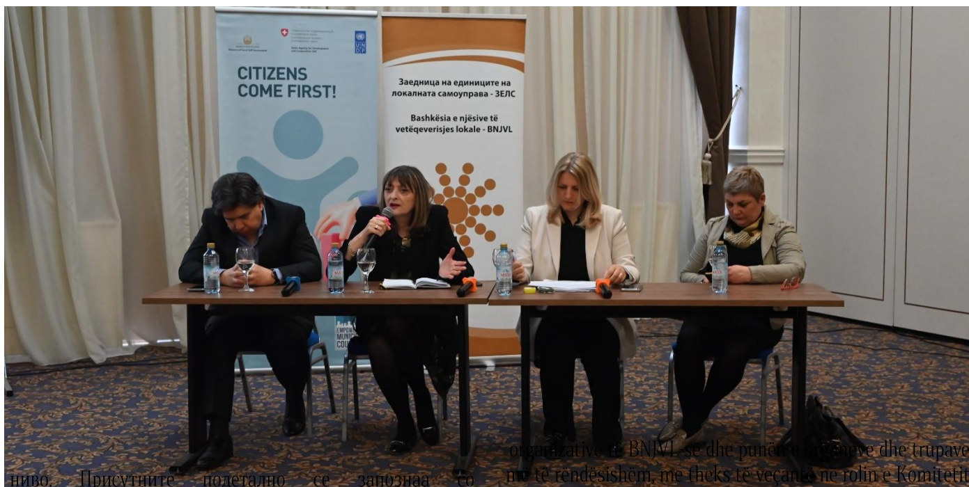
ниво. Присутните подетално се запознаа со

Këshillim për këshilltarët nga komunat e Rajonit Planifikues Verilindor u mbajt më 27 mars, 2026 në hapësirat e Shtëpisë së zejtarëve nga Kumanova, që e siguroi komuna e Kumanovës. Qëllimi është të sigurohet zbatimi më efikas dhe më i përgjegjshëm i detyrimeve të këshilltarëve komunalë në kuadër të zbatimit të kompetencave në nivel lokal. Të pranishmit u informuan më detajisht me strukturën